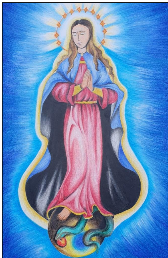
Nový obrázek Neposkvrněného početí Panny Marie od Laury Rosina