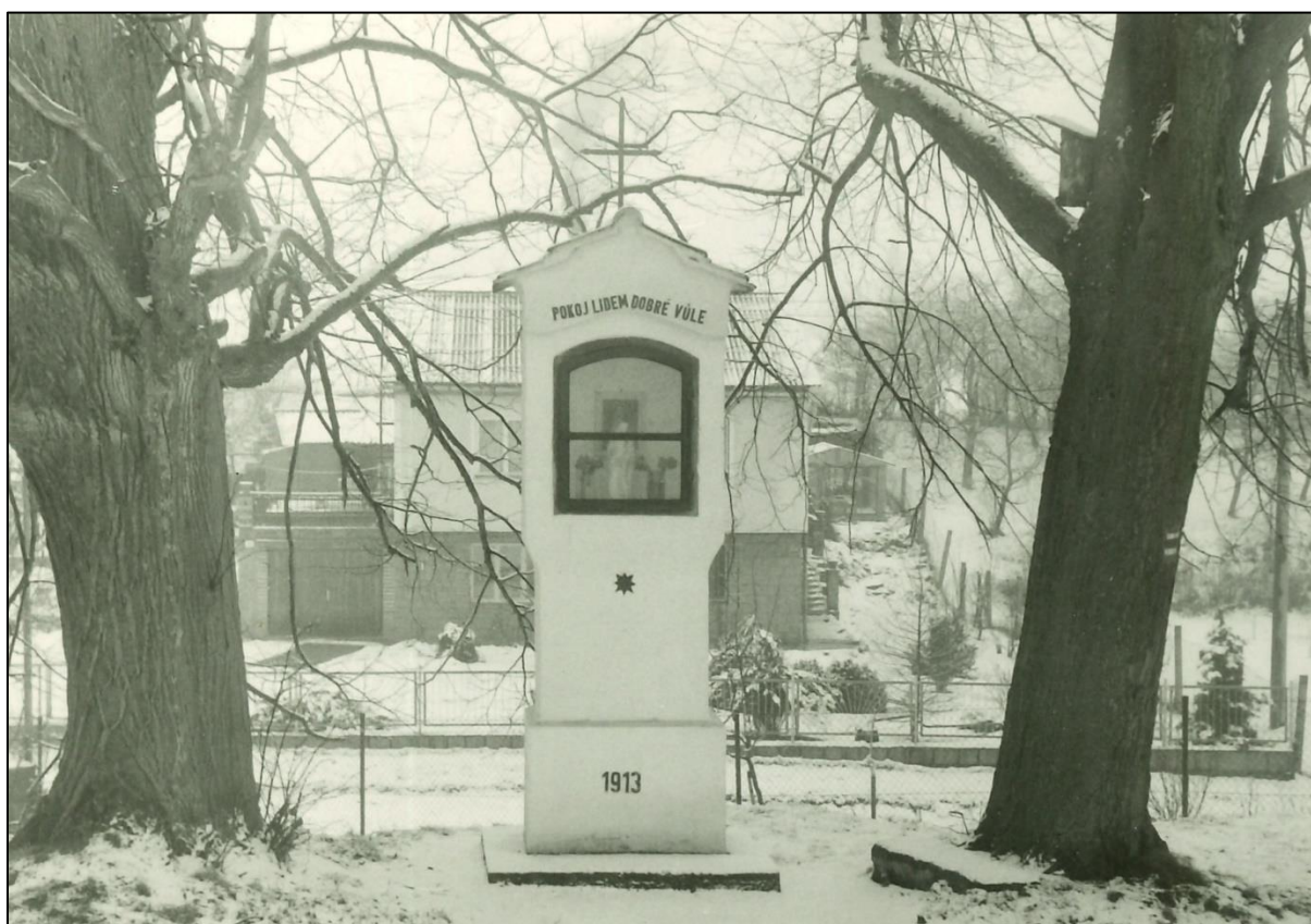
Opravená kaplička na snímku z 12. 4. 1985