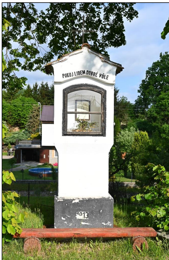
Kaplička před renovací, červen 2022