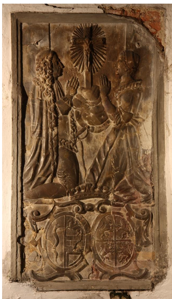
Epitaf Josefa Serényiho u oltáře sv. Josefa a krycí deska serényiovské krypty v kněžišti děkanského kostela Nanebevzetí Panny Marie v Blatné