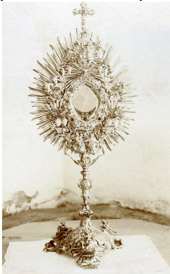
Blatenská monstrance z roku 1744

Během let ozdobily Blatnou i další sochy světců , kteří měli chránit město a jeho obyvatele před živelními pohromami, nemocemi a válkou. Na zaniklém mostě u děkanství (fary) to byli sv. Jan Nepomucký a sv. Prokop, z nichž tento, zhotovený roku 1732, je dnes umístěn ve výklenku při severní straně fary. Most nad splavem zámeckého Jezera nesl sochy Ukřižovaného Krista a Panny Marie Bolestné, na mostu do zámecké zahrady stály dřevěné sochy sv. Václava a Jana Nepomuckého, na dolním konci Koubkovy třídy socha sv. Václava z roku 1756, posléze přesunutá k nádraží, kde je dnes nahrazena kopií. Podobně je tomu i v případě sochy sv. Floriána u fary. Ta byla instalována roku 1766, bezesporu po požáru, který tehdy postihl zámek. Originály těchto soch, včetně originálů skulptur a heraldických prvků z mariánského sloupu, se nachází v zahradě domova pro seniory.