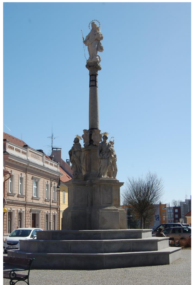
Socha sv. Prokopa u fary – mariánský sloup na náměstí – socha sv. Václava u nádraží – socha sv. Floriána před farou