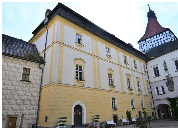
Takzvané rozdražovské křídlo blatenského zámku