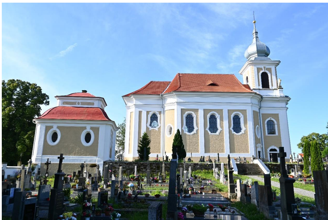
Kostel sv. Jana Křtitele v Paštikách – poslední dílo K. I. Dientzenhofera

Po dokončení prací na děkanském chrámu se pozornost hraběnky – vdovy obrátila k již značně sešlému filiálnímu kostelu v Paštikách , který nechala v letech 1747–1752 přestavět do současné vrcholně barokní podoby. Středověký kostel se tak proměnil ve vrcholné architektonické dílo a významnou krajinnou dominantu. Práce na výzdobě interiéru a na mobiliáři pokračovaly ještě v dalších letech.