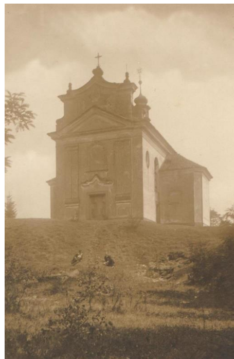
Poutní kostel na Křesovci počátkem 20. století