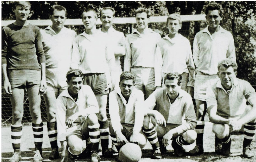
Předchůdce TJ Lom – TJ JZD Škvořetice

Na další fotografii kompletní řešení ani letopočet nevíme, takže přivítáme každé upřesnění: